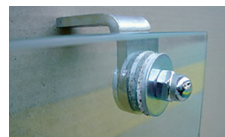
« ECO » fixation en acier