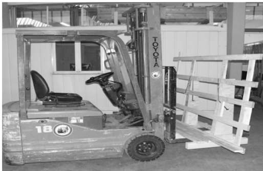
Anwendung mit dem Stapler. Manutention avec chariot élévateur.