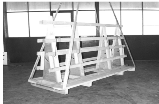
Die Gestelle sind kranbar. Manutention avec palan.